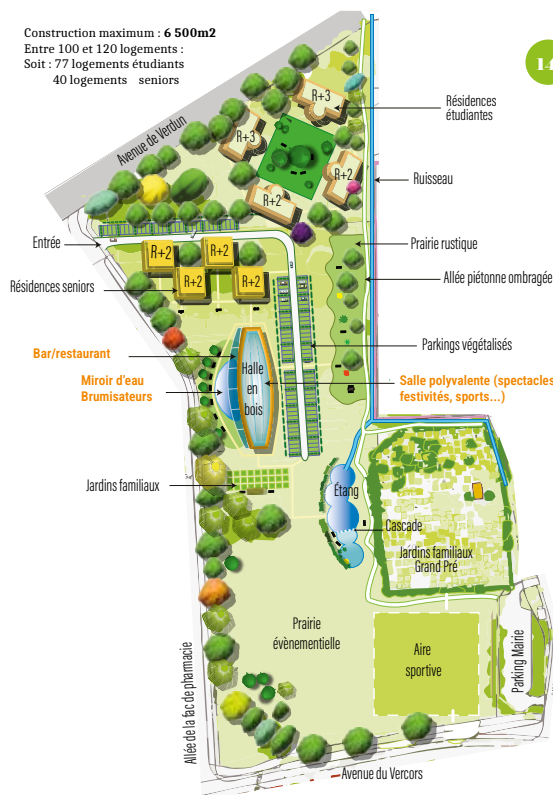
Illustration réalisée d'après le schéma d'idées de Gine Vagnozzi

“ Meylan ne doit pas devenir un quartier de Grenoble ”